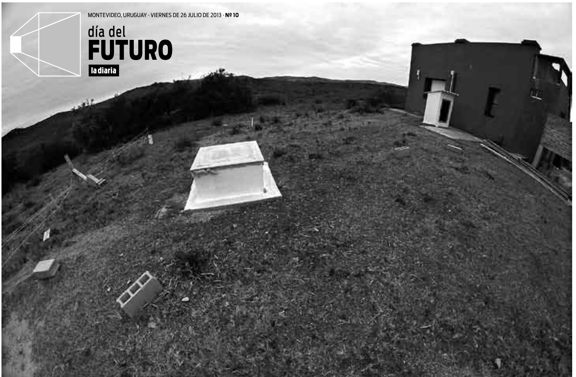
Nicho donde se encuentra el sismógrafo del Observatorio Geofísico de Aiguá, ubicado en la estancia turística Lagunas del Catedral; sus coordenadas son -34^{\circ} 20' 0,89'' S y -54^{\circ} 42' 44,72'' W , h: 270 m.